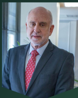
Benjamin Zymler Ministro do TCU