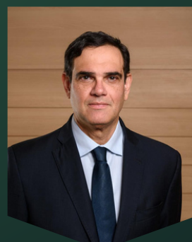
Marcos Nóbrega Conselheiro do Tribunal de Contas de Pernambuco

Saiba mais sobre nossos palestrantes! Acesse o currículo na nossa landing page: