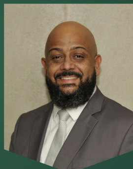
Paulo Alves Presidente da Companhia Brasileira de Governança