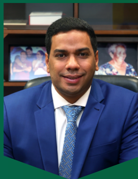
Jonathan de Jesus Ministro do TCU