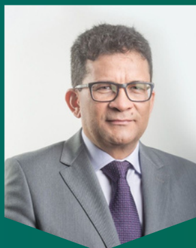
Antônio Blecaute Conselheiro Substituto do TCE/MA